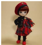
キルト衣装セット