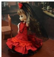
フラメンコ: 黒ベールとバタデコーラ

民族衣装をテーマとした「エトノス」には、ほかに以下のような作品がございます。機会がありましたらぜひお手に取ってごらんください