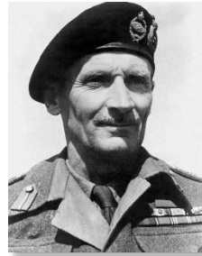
Ⓜ 第二次大戦時の連合軍・モントゴメリー将軍。「モンティ・ベレー」を流行らせたひと