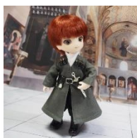
グルジア衣装： カルトリの戦士